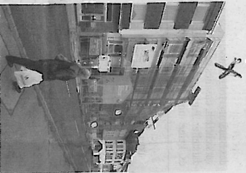
Stillstand nach Fertigstellung des Rohbaus an der Altstadtstraße.

Opladen - „Boomtown“ Altstadt! An keiner anderen Stelle entstehen in Opladen derzeit so viele neue Wohnhäuser wie im Bereich zwischen Kanalstraße und Düsseldorfstraße. Investoren sind sowohl private Bauherren als auch der genos-